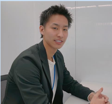
トイカード 営業部 2021年 入社