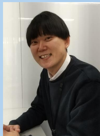
トイカード 営業部 2018年入社