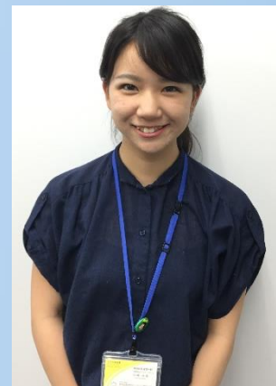
トイカード 営業部 2017年 入社