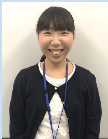
キッズスマイル保険 事務部 2018年入社